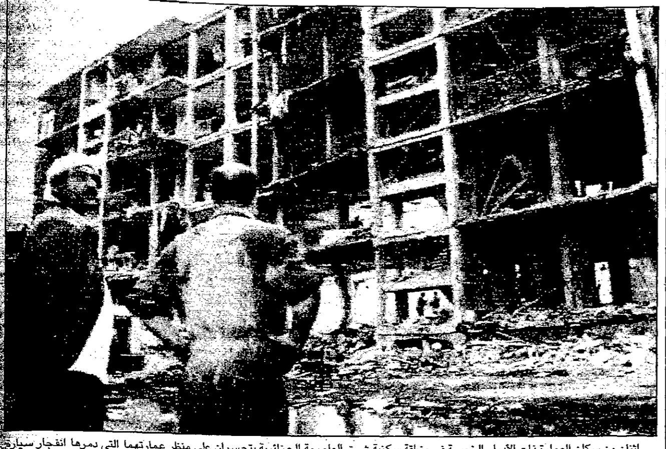
اثنتان من سكان العمارة ذات الادوار الخمسة في منطقة سكنية شرق العاصمة الجزائرية يتحسرون على منظر عمارتها التي دمرها انفجار سيارة مفخخة

بيروت من كاش عباس ارتفعت صورة الود الساحة الدولية للسانيد سعي ادرات الضالفة جبهة الى التمسك عن الاخرى وهما بيد الاخره السالبة عن منحصورة للفلاف بل خلافات ضد واحد